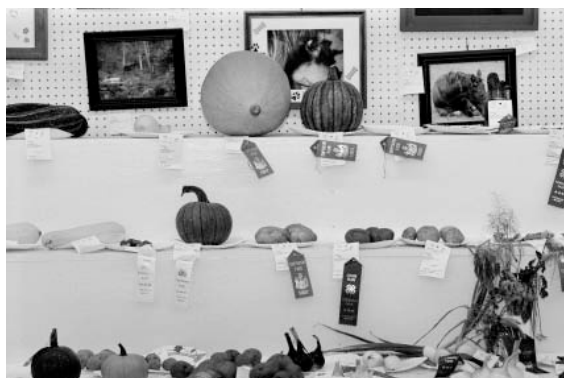
Gerard Byrne, Images or shadows of divine things [Des images ou des ombres de choses divines] Série de photographies Courtesy de l'artiste et galerie Lisson, Londres 2005 – en cours