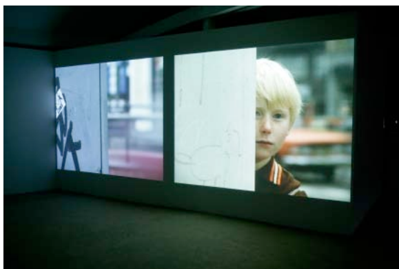
Amie Siegel, Berlin Remake , 2005 Double vidéo sur moniteur Vue de l'exposition au KW, Institut d'art contemporain, Berlin, 2005