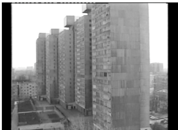
Józef Robakowski, From my window (1978 – 1999) [De ma fenêtre (1978 – 1999)], 2000 16 mm transféré sur vidéo, noir et blanc, 20 min