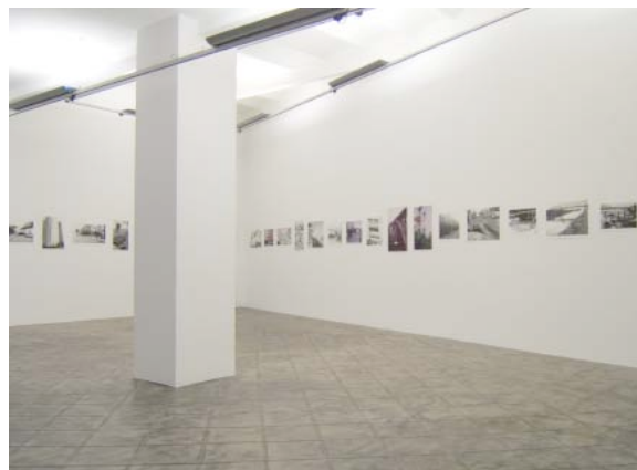
Peter Piller, Vue de l'exposition « Arrows » [Des flèches], Galerie ProjecteSD, Barcelone, 2006

Visuels en 300 dpi disponibles sur demande auprès de Marjolaine Calipel Les vues d'exposition seront disponibles à la fin septembre T : 01 49 42 67 17 – marjolaine.calipel@noisylesec.fr