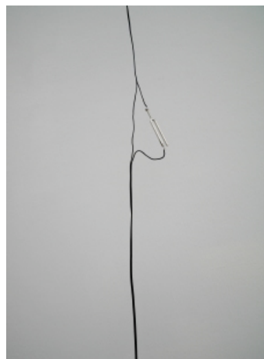
Jason Dodge, A current (electric) through (A) tuning fork and light , 2007 [Un courant (électrique) à travers (un) diapason et de la lumière] Collection privée, France