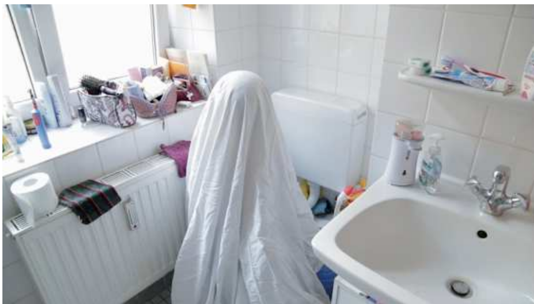
Loretta Fahrenholz, My Throat My Air , 2013 – Vidéo, 16´47" – Courtesy de l'artiste

1 rue Jean-Jaurès F - 93130 Noisy-le-Sec T : + 33 (0)1 49 42 67 17 F : + 33 (0)1 48 46 10 70 lagalerie@noisylesec.fr