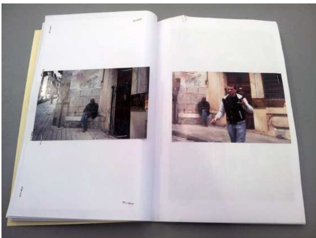
Cidade Crua, 2013

Collection de 4 livres avec photographies