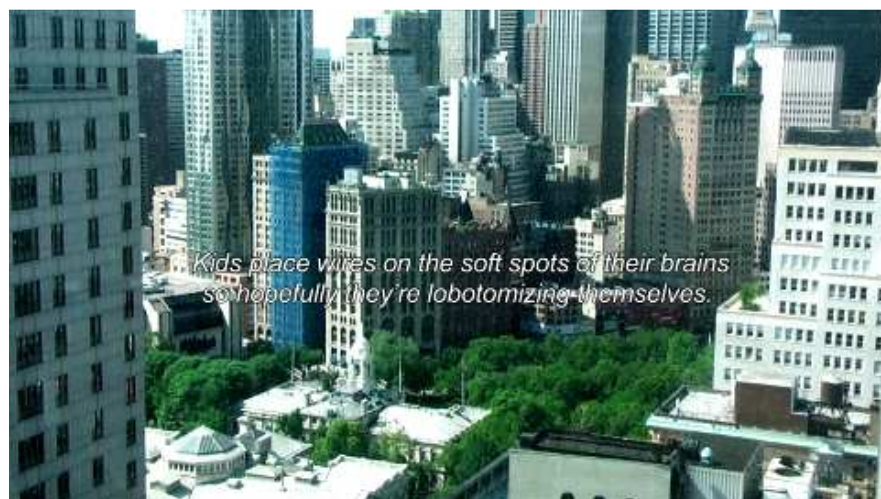
Implosion , 2011