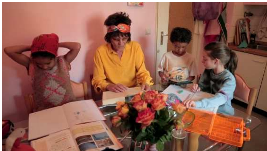
My Throat My Air , 2013