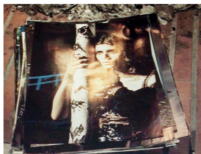
les allumeuses , 1998–2010, 2011 Vidéo, son, 13'18" Prise de vue : Caroline Arnaud Courtesy Semiose galerie, Paris