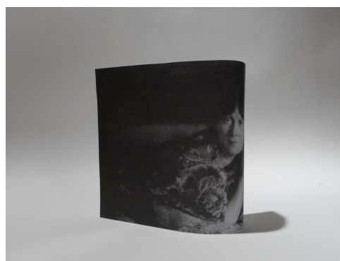
Soi derrière soi #1, 2015 Document de travail