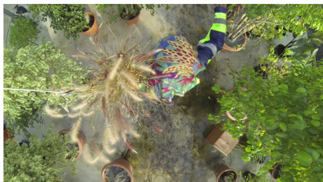
Opéra-archipel, la serre à palabre, 2015 Vidéo, 30'