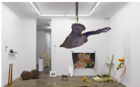
Le Plaisir dans la confusion des frontières sur Scroll infini , 2015 Divers éléments et photographie, dimensions variables