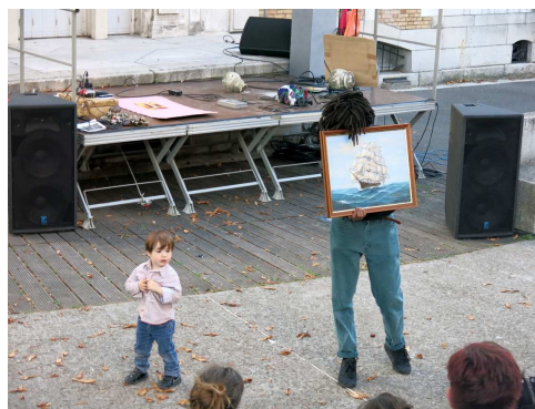
Opéra-archipel, 2014 Performance pour les 15 ans de La Galerie, 27 septembre 2014