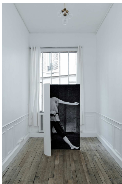
Sans titre (Dana), 2014 Impression sur papier, aluminium, peinture 188 x 143 x 35 cm Exposition Triangle France