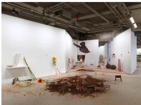
Le Plaisir dans la confusion des frontières , 2014 à la Fondation d'entreprise Ricard, Paris