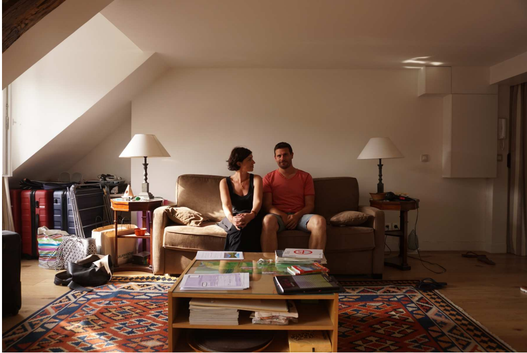
The Interloper , 2017 Intervention en cours