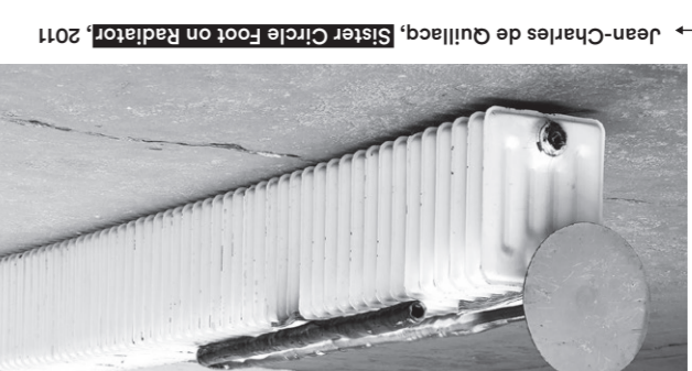
Jean-Charles de Guillaucq, Sister Circle Foot on Radiator , 2011