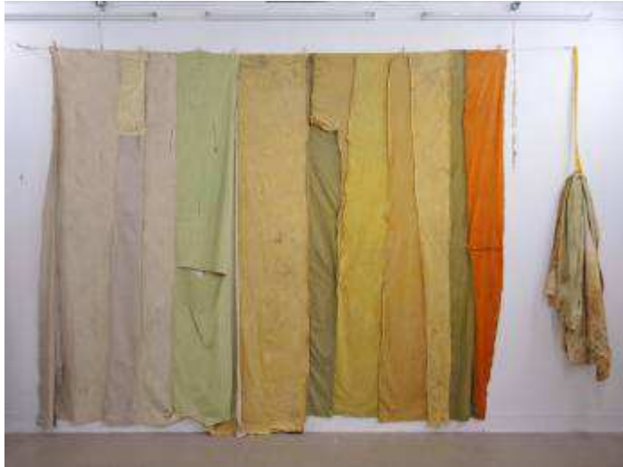
Œuvre en cours, février 2016