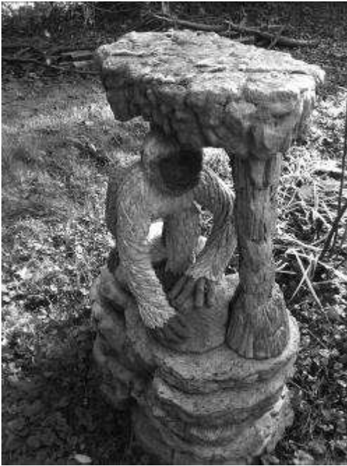
Le singe , 2005, béton