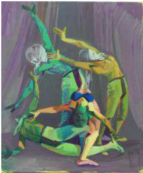
Group 3 , 2011 Huile sur toile 55 x 46 cm