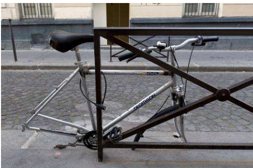
Eva Barto, The thief , 2015 Tentative de plagiat à partir d'une photographie d'une œuvre de Jérôme Leuba, Vélo modifié, coupé, ressoudé, une face seulement