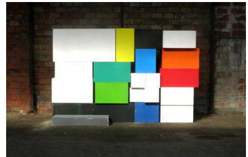
Contrepartie, fausses teintes (Alpha) , 2015 Photographie