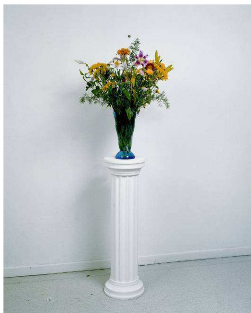
Bouquet perpétuel , 1988