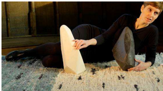
The Good, the Bad, the Happy, the Sad , 2014 Performance, ±22' Vidéo : Bas Schevers Courtesy de la galerie Fons Welters, Amsterdam