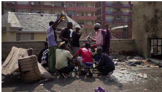
Hillbrow , 2014 Vidéo, son, 32' Avec le soutien du CNAP et de l'Institut français