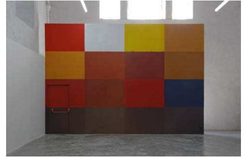
http://fr.wikipedia.org/wiki/Le_Radeau_de_La_M%C3%A9duse#/media/File:Couleurs_radeau_meduse.png , 2015 Peinture murale, pigments, liant acrylique 646 x 449 cm