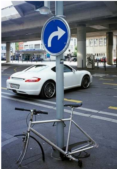
Jérôme Leuba, Battlefield #101 / bikes , 2014 Installation 10 vélos faussement cassés ou volés installés à Steinfelplatz à Zürich Gasträumen 2014 / Art in Zürich Art dans l'espace public, avec la galerie annex14, Zürich