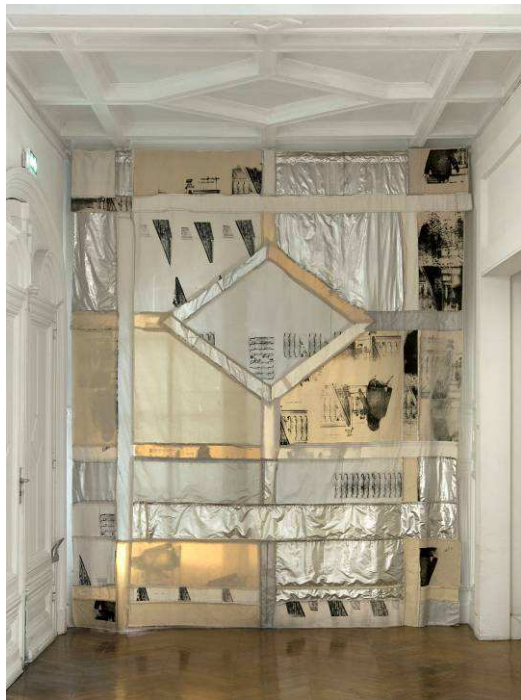
Rideau , 2014