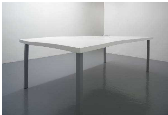
La table sans nom , 2004