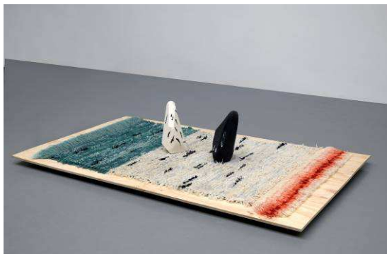
The Good, the Bad, the Happy, the Sad , 2014 Installation, bois, pâte à modeler, laine