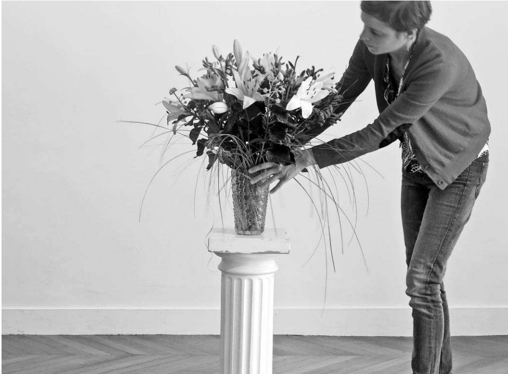
Joachim Mogarra, Bouquet perpétuel , 1988. Entretien de l'œuvre à La Galerie, septembre 2015. Collection Frac Aquitaine.