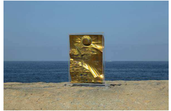
Fragmenta Malta, 2015 Détail de l'exposition The Valley of Thousand Pleasures de Jagna Ciuchta et Samir Ramdani, Laiton, plexi, auteur inconnu, Photo : Samir Ramdani.