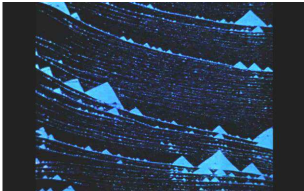
Du haut de ces pyramides, derrière, 1972–2015 “Le trou bleu. Passage du temps” “La contrée dévoilée” Film 16 mm couleur, transféré sur numérique, muet 4'