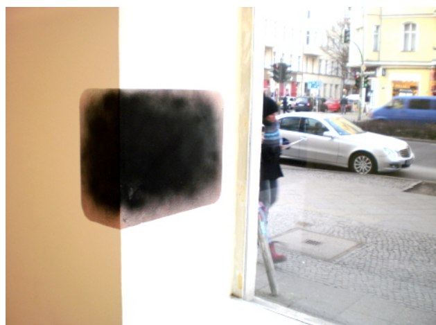
Vue de l'exposition « Ecotone » au Kunstverein Tiergarten, Berlin, 2011

En 300 dpi sur demande : marjolaine.calipel@noisylesec.fr T : +33 (0)1 49 42 67 17 Vues d'exposition disponibles mi-septembre