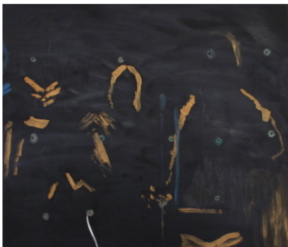
communauté perdue , 2012 Huile sur toile 60 cm x 80 cm