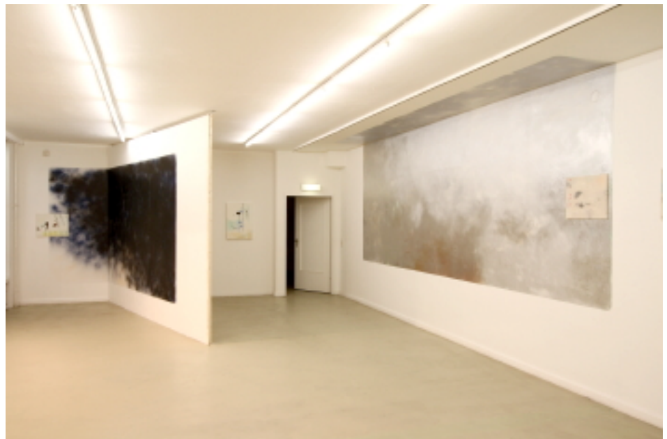
Musique de chambre, 2011 Vue de l'exposition « Ecotone » au Kunstverein Tiergarten, Berlin.