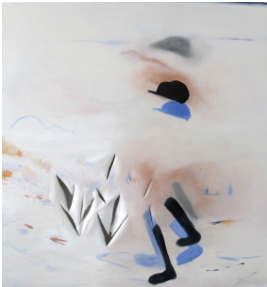
as I was going along , 2012 Huile sur toile 180 cm x 170 cm

Emmanuelle Castellan / Exposition personnelle Commissaire : Marianne Lanavère