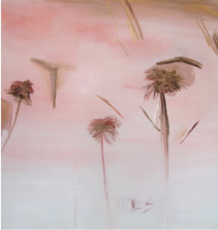
figure 2, 2012 Huile sur toile 180 cm x170 cm

En 300 dpi sur demande : marjolaine.calipel@noisylesec.fr T : +33 (0)1 49 42 67 17 Vues d'exposition disponibles mi-septembre