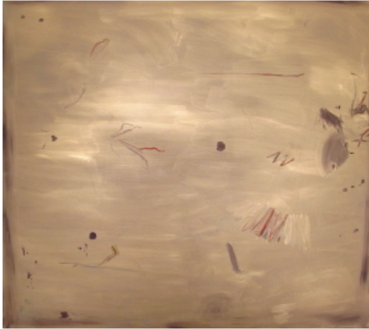
l'une et l'autre , 2012 Huile sur toile 180 cm x 200 cm