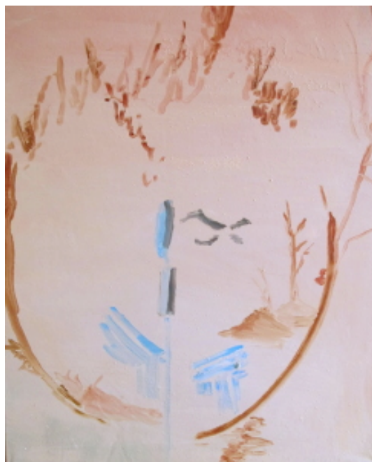
old winter , 2012 Huile sur toile 62 cm x 52 cm