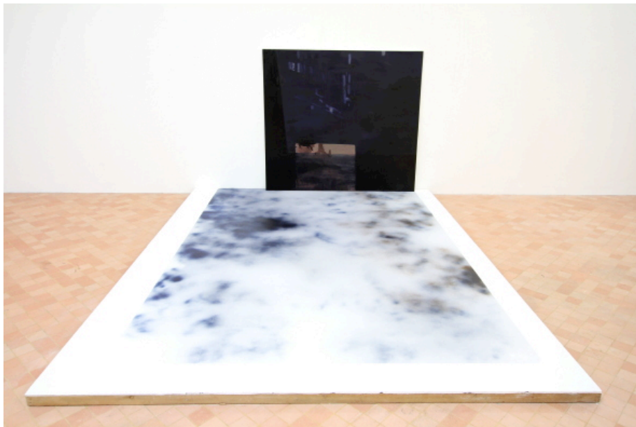
Berlin nuit , 2011 Huile sur toile et peinture, 190 cm x 170 cm et peinture en bombe sur plaque de contreplaqué, 300 cm x 400 cm Vue de l'exposition « Ecotone » à la Maison des Arts Georges Pompidou, Cajarc.

En 300 dpi sur demande : marjolaine.calipel@noisylesec.fr T : +33 (0)1 49 42 67 17 Vues d'exposition disponibles mi-septembre