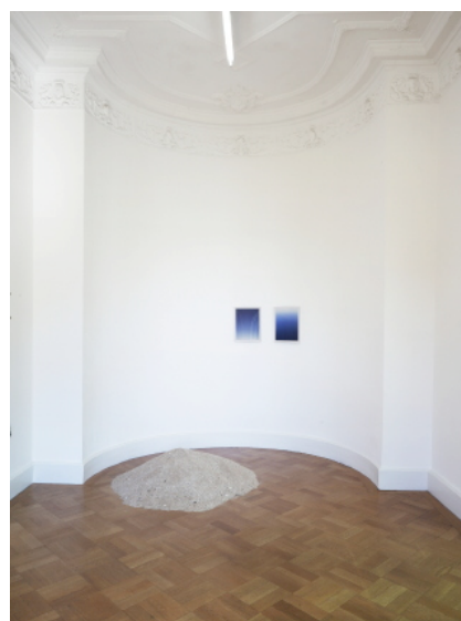
Vue de l'exposition « Salo » au Kunstverein Braunschweig, Brunswick 2010