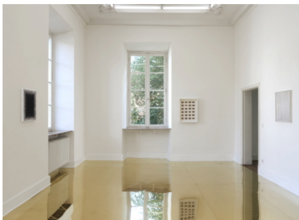
Atol Vue de l'installation au Kunstverein Braunschweig, Brunswick 2010