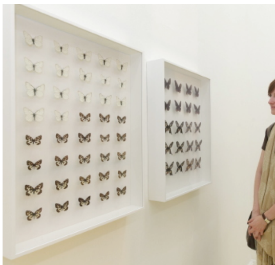
Atol Vue de l'installation au Kunstverein Braunschweig, Brunswick 2010