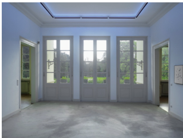
Vue de l'installation Pierre, Pierre Kunstverein Braunschweig, Brunswick 2010

Visuels 300 dpi disponibles sur demande auprès de Marjolaine Calipel Les vues d'exposition seront disponibles à la mi-décembre T : 01 49 42 67 17 – marjolaine.calipel@noisysec.fr