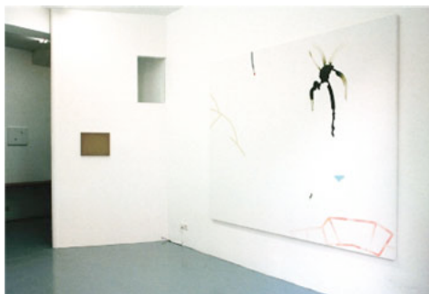
Samuel Richardot Vue d'exposition, galerie Balice Hertling, Paris Untitled , 2007 Technique mixte sur toile, 200 x 250 cm