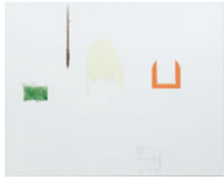
Samuel Richardot, Untitled , 2008 Technique mixte sur toile, 200 x 250 cm