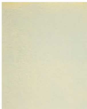
Samuel Richardot, Peau , 2008 Acrylique sur toile, 33 x 41 cm