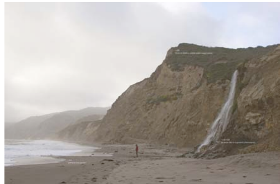
Richard T. Walker Hesitant due to repeated achievement , 2008 Tirage c-print, San Francisco Courtesy de l'artiste et d'Angels Barcelona