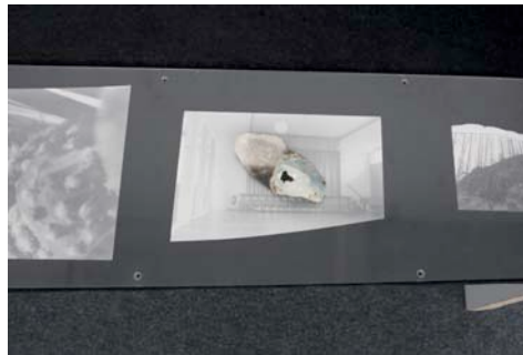
Reto Pulfer, Aquariumspiel in 128 Zuständen (PMG) (détail), 2007 Aquarium, meuble en bois, velours, 4 photographies n/b, céramique Taille variable (ca. 65 cm x 80 cm x 70 cm)