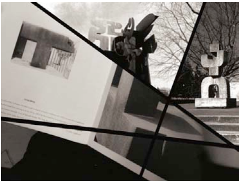
Falke Pisano, Chillida (Forms and Feelings) , 2006 Double vidéo sur moniteur, DVD, 14 min.