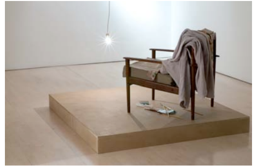
Clare Gasson, The Washaway Road , 2008 Pièce sonore, scène, fauteuil et lumière