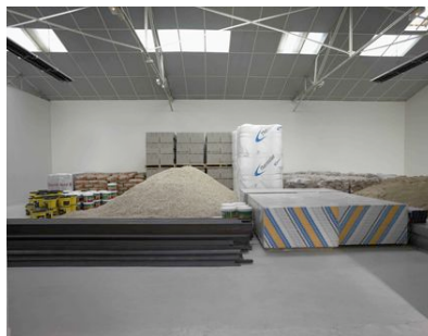
Lara Almarcegui Matériaux de construction , 2003 Vue de l'exposition « 1:1 x temps, quantités, proportions et fuites » au Frac Bourgogne, Dijon, 2003