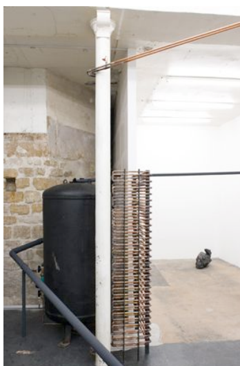
Katinka Bock L'angle chaud , 2007 Système de chauffage, cuivre, acier, eau de pluie 78 x 37 x 174 cm Vue de « Baume wachsen und Ströme fließen: Wasser, Wärme, Monument », exposition personnelle à la Galerie Jocelyn Wolff, 2007