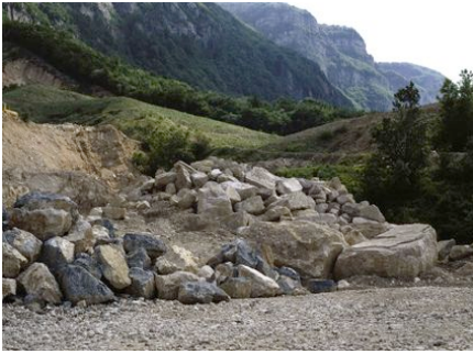
Beat Lippert Métamontagne 1 , 2007 C-print 50 x 70 cm