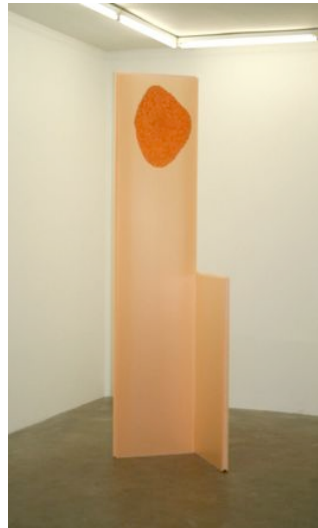
Gyan Panchal nistan , 2008 Polystyrène extrudé 260 x 35 x 62 cm