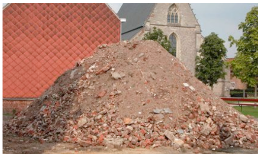
Lara Almarcegui Montagne des débris , 2005 Sint Truiden, Belgique