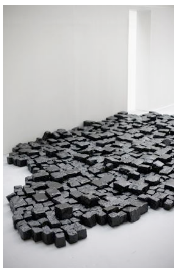
Katinka Bock Le sol d'incertitude , 2007 14 m2, pavés de Paris, goudron Vue de « Katinka Bock, volumes en extension », exposition personnelle au Centre d'art Passerelle, Brest, 2007