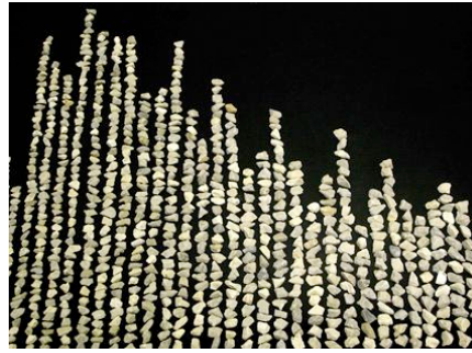
Beat Lippert Tri de 4 kg de gravier au décigramme , 2006 Technique mixte 420 x 80 cm