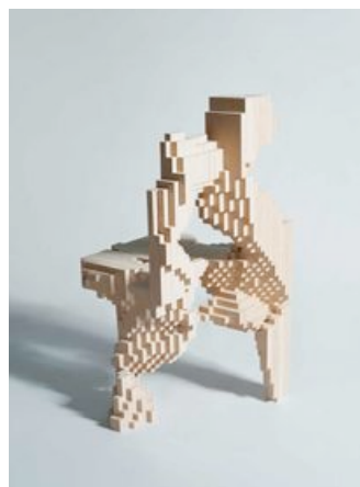
EZCT Architecture & Design Research Studies on Optimization: computational chair design using genetic algorithms , 2004 Programmation C++, algorithmes génétique et calcul de structure : Hatem Hamda, Marc Schoenauer (INRIA Futurs - projet TAO) Xd3d Software (logiciel de visualisation & de calcul par la méthode des éléments finis, License publique générale GNU) : François Jouve (Ecole Polytechnique) Programmation Mathematica EZCT Architecture & Design Research, © 2004